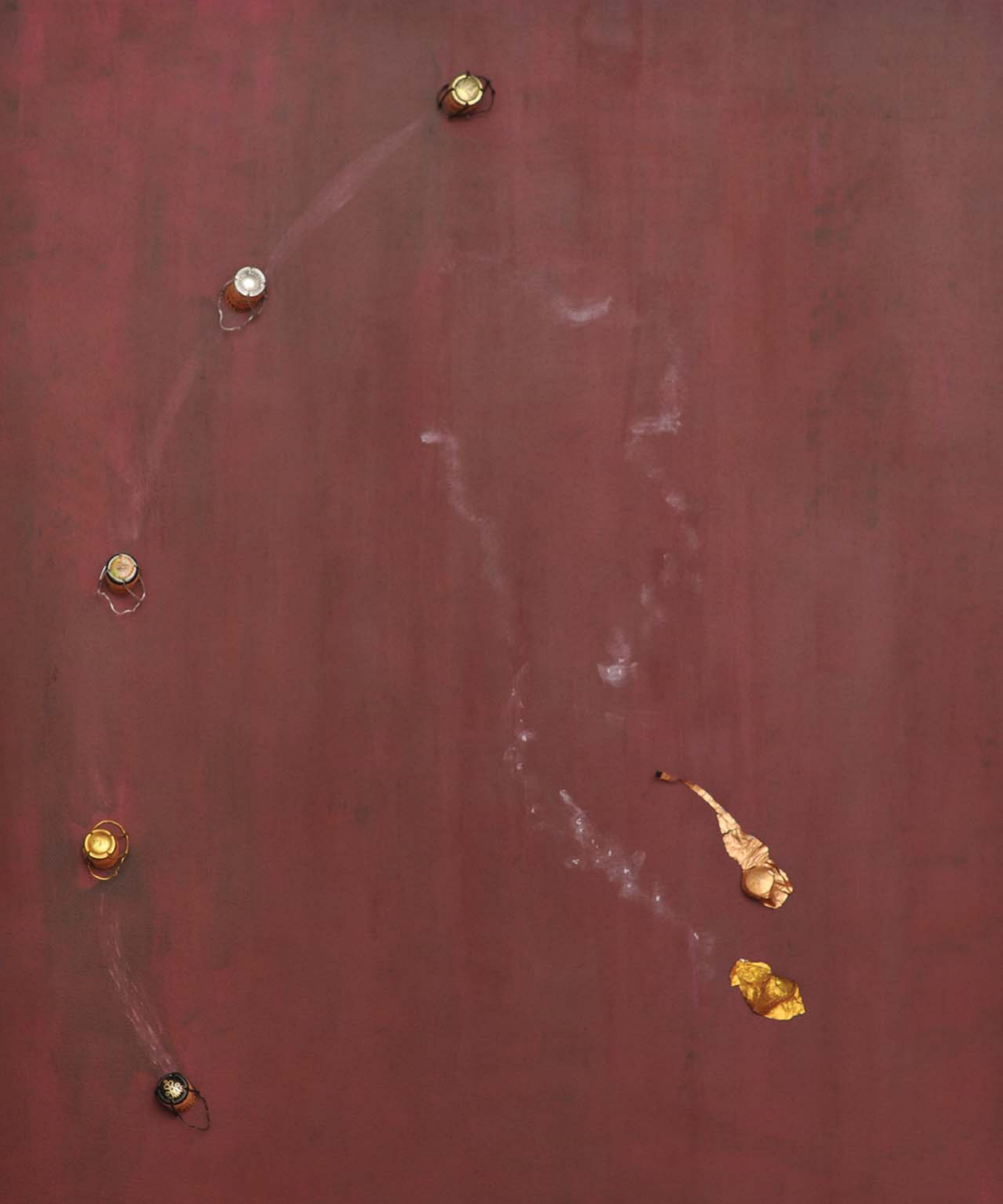
Pjenušavo uživanje / Sektgenuß, akril, komb.teh., platno / Acryl, Mischtechnik auf Leinwand, 120 x 100 cm, 2013.