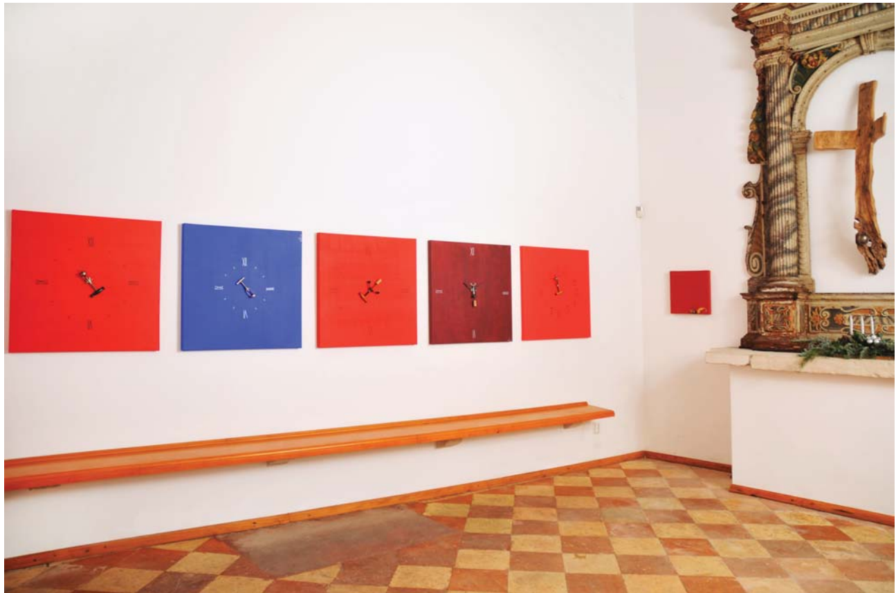
Time for Wine - dio postava izložbe / Teil der Ausstellung

Upravo stoga, Beckerovo slikarstvo jest spretan spoj modernizma, postavangardističke likovne prakse, slikarstva koje izlazi iz svoje dvodimenzionalnosti i zadire u spektar skulpture. Radi se o svojevrsnim assamblageima s iskustvom Armana, Lucie Fontatne i Yvesa Kleina, a koje će u dogledno vrijeme, zasigurno, rezultirati još smjelijim reduktivističkim rješenjima i još naglašenijim, ali ništa manje minimalistički nastrojenim akordima unutar zadane partiture. U svakom slučaju, autor se bavi vrlo intuitivnim stvaralačkim činom i na putu je stvaranja svojeg osobnog rukopisa i stila. Ukoliko je prema Croceovoj definiciji umjetnosti umjetnost dobra u onoj mjeri u kojoj se u njoj osjeća primarni izraz, tada je slutiti da se Beckerovi najsjajniji momenti, unatoč nadvladavanju ratia, stroge preciznosti i gotovo bogobojznog držanja pravila strogih kompozicijskih parametara, nalazi upravo u onim zgužvanim ostacima folije vinske ambalaže, razvedenim parabolama i naglašenim dijagonalama. Zakon pijenja je kao i zakon ljubavi: bilo kada, bilo gdje i bilo kako. Ali kao u ljubavi i u piću su važne sve okolnosti, pa tako i u radovima Axela Beckera, autora čije će slikarstvo ukoliko mu se analitično bude posvetio kao istraživanju vina, siguran sam, s vremenom pratiti sudbinu svakog pažljivo tretiranog „tečnog poljupca“.