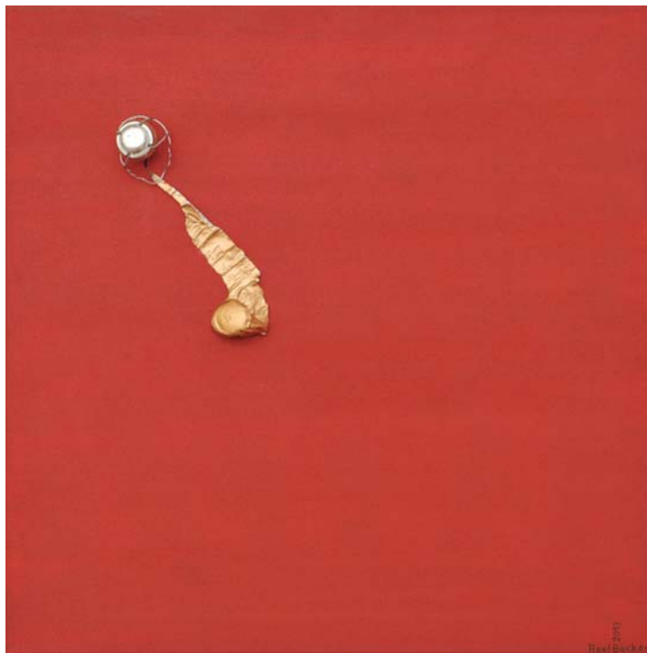
Početak / Beginn , akril, komb.teh., platno / Acryl, Mischtechnik auf Leinwand, 50 x 50 cm, 2013.