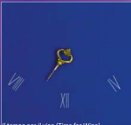
Il tempo per il vino ( Time for Wine )

La mostra 3D al castello di Bogenšperk mostra diversi periodi della mia creazione artistica. All'inizio raffigura il mio periodo di creazione iniziale, che rappresentano i dipinti dal Tempo per il vino ( Time for Wine ) e contiene una varietà tridimensionale di orologi a forma di apertura recanti il messaggio "Prendetevi il tempo per il buon vino". Segue un periodo di sculture a forma di zinco che mostrano anche elementi tridimensionali diversi dal metallo. Le opere d'arte contengono i riflessi di luce del metallo, ma sono anche interattive per il pubblico. L'ultimo periodo va nella direzione delle sculture dal dipinto. Il mio lavoro nel 2008 con il prof. Josip Diminić qui ha avuto una grande influenza.